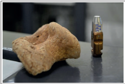
Figura 4.2. Portamuestras para la medida por AMS junto a una muestra tipo.