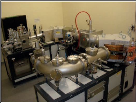
Figura 4.3. MICADAS, sistema de detección del radiocarbono en el Centro Nacional de Aceleradores.